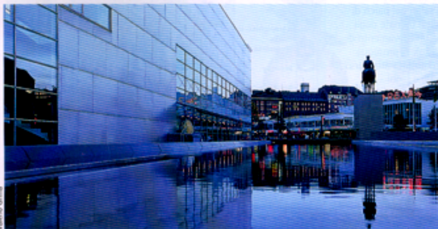
Il museo di arte contemporanea Kiasma, ideato dall'architetto americano Steven Holl.

Weekend a prezzi speciali. Fino al 17 novembre, diversi tour operator offrono un pacchetto da 325 € con volo a-r (da Milano/Roma, 2 notti in doppia in hotel di 1° cat., la Helsinki Card che dà diritto all'uso gratuito dei mezzi pubblici, all'ingresso libero in musei e gallerie oltre a forti sconti nei negozi e ristoranti). Informazioni: Ente nazionale finlandese per il turismo o Finnair (pag. 218).