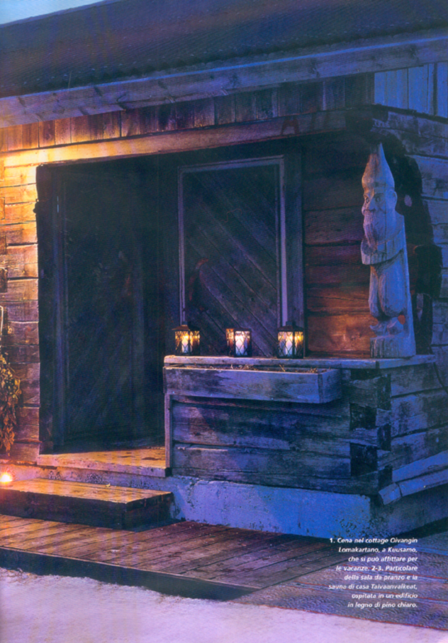
1. Cena nel cottage Oivangin Lomakartano, a Kuusamo, che si può affittare per le vacanze. 2-3. Particolare della sala da pranzo e la sauna di casa Taivaanvalkeat, ospitata in un edificio in legno di pino chiaro.