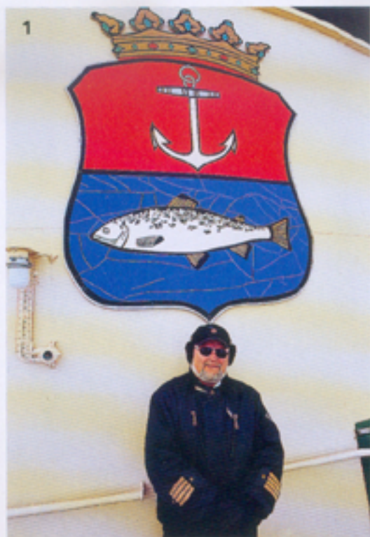
1. Il comandante della Sampo, nave rompighiaccio oggi utilizzata per crociere. 2. Gli ospiti della Sampo, protetti da tute termiche, provano l'ebbrezza di un bagno nelle gelide acque del mare artico. 3. Pesca con la rete sul lago ghiacciato di Kuusamo. 4. Köngäs: escursione con una slitta trainata dai cani husky.

merci. Oggi si sfidano in gare di renne e di slitta, spettacolo divertentissimo oltre che inusuale. Lanciate al galoppo, le renne sfrecciano sulla pista guidate da abili fantini che si muovono con gli sci da fondo. In questa gara rocambolesca quello che colpisce è il silenzio. Nessuno urla, grida, applaude. Si riprende la strada verso sud per raggiungere Köngäs , un gruppo di case sparse sul lago. L'arrivo al tramonto alla Taivaanvalkeat House (biancore del cielo) è una meraviglia, avvolti dalla luce boreale nitidissima, le nuvole che si rincorrono nel cielo azzurro. La casa è stata costruita nel 1995, in legno di pino grigio vecchio di cent'anni. All'interno si ritrovano il profumo del bosco, le luci morbide del crepuscolo, il calore nordico. Il grande soggiorno-pranzo è il centro della convivialità; la sala da tè adiacente ha una ricca collezione di peltri e la luminosa veranda sul lago. Otto camere e tre bagni lungo lo stretto corridoio che si apre sulla stanza del pianoforte e una sala con mobili antichi, usata come spazio relax con cyclette e lettini massaggio. A fianco, l'immancabile sauna con docce multigetto e jacuzzi. Al piano di sopra, quattro grandi e luminose stanze a tre letti, due bagni e una veranda centrale come disimpegno. Tre giorni sono il minimo per godere di questa piacevole esperienza. Si può affittare l'intera casa a mezza pensione o completa, con cuoca e personale per le pulizie, in un'atmosfera fuori del mondo. Le cene sono super raffi-