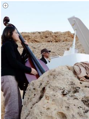
Concerto nel deserto del Sahara con Norama di Bergamo

25 marzo 2014 | Viaggi e Turismo | Commenta